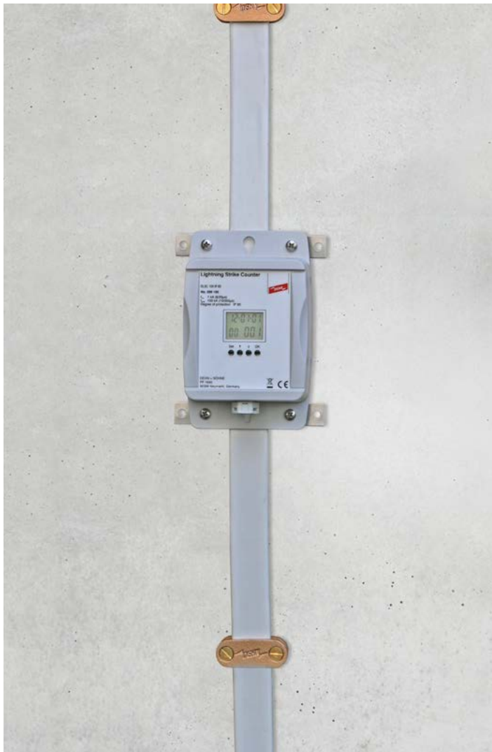
Montage an einem Flachleiter

Der Blitzzähler eignet sich für Neu- und Bestandsanlagen. Er wird direkt auf der Ableitung montiert. Dies ist auf Flach- und Rundmaterial möglich.