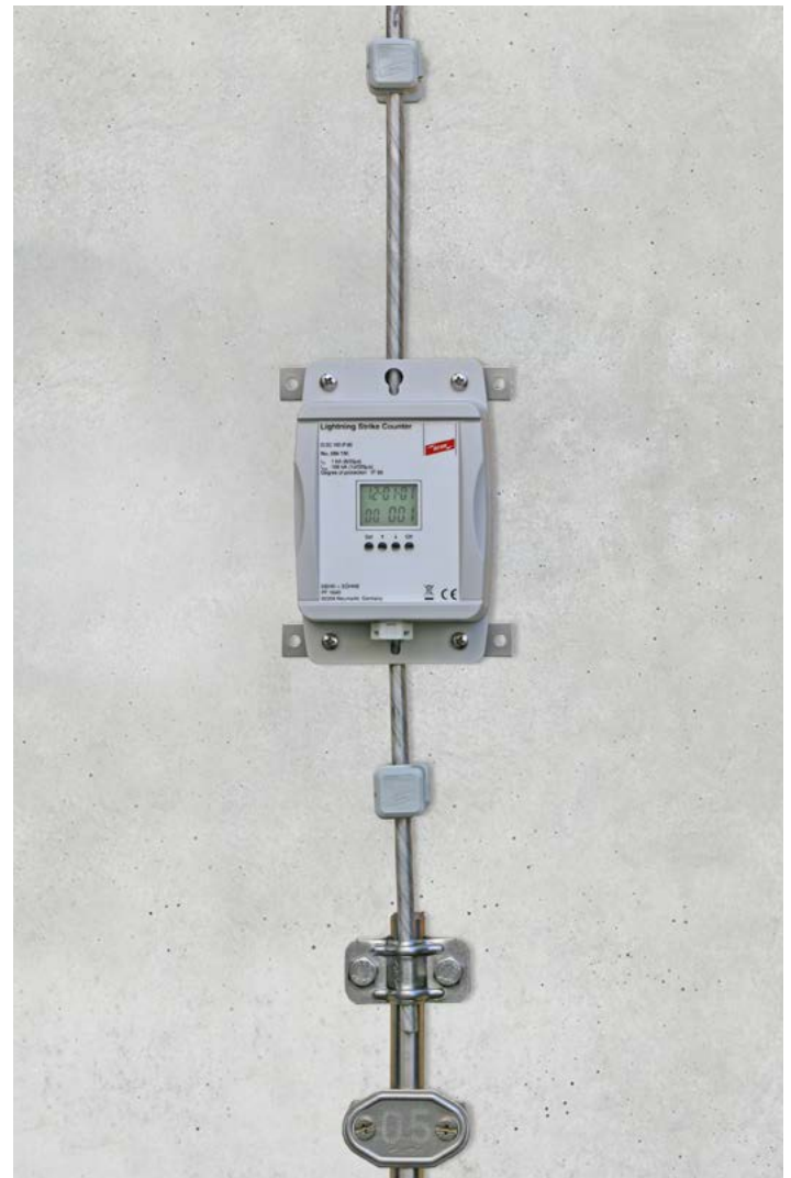
Montage an einem Rundleiter